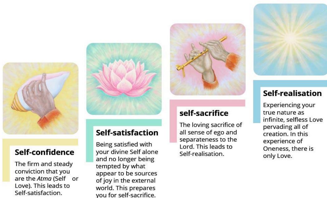
Figuur 1. Sathya Sai Baba's stappen naar Zelfbewustwording

Zelfvertrouwen - De ferme en standvastige overtuiging dat je het Zelf of liefde ( Atma ) bent. Dit leidt tot Zelfvoldoening.